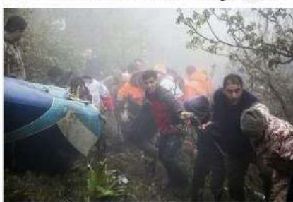
Dalam foto yang ditunjukkan keater berita Moj, anggota tim penyelamat bekerja di lokasi jatuhnya helikopter yang menewas Presiden Iran Ebrahim Raisi di Parangdih di barat laut Iran, Senin (20/5/2024). Raisi dan beberapa pejabat lainnya diturunkan tewas.

BUMI SERIK — Iran tengah berdebat. Presiden Ebrahim Raisi, Senin (20/5/2024), dipastikan belum akan kekosokan kembali pada Sabtu tak. Pemukiman Asia diputar pada Selasa (20/5). Pemimpin Tertinggi Iran Ayatollah Ali Khamenei telah menunjuk Wakil Presiden Pertama, Muhammad Mokhber menjadi presiden interim. Sementara itu, Ali Bagheri ditunjuk jadi Pejabat Menteri Luar Negeri, ia menggantikan tugas Menteri Iran Hassan Javadi-Abdolmohammadi yang juga tugas dalam hubungan di Perwakilan Amerika Timur Tengah. Ali Bagheri pernah terlibat dalam penempatan program nuklir Iran. Kala itu, ia menjadi perantara utama masalah Iran. Ali Bagheri juga dikenal sebagai negosiator, terutama kepada negara-negara Barat. Ali Bagheri tidak dianggap kelompok ultrakonservatif Iran. Ia anggota jenderal dalam Ali Khamenei, yang merupakan ayah mertua dari saudara laki-laki Ali Bagheri. Kebijakan Iran pada Senin menggunakan, selain Raisi dan Ayatollah, korban tewas ini adalah Gubernur Azerbaijan Timur Mahdi Karubi. Komandan Pasukan Pengaman Presiden Mohd Moazzad dan Utusan Pemimpin Tertinggi Iran Muhammad Ali Al-Husseini. "Tidak lama setelah pengumuman resmi itu, kabinet Iran menghormati pernyataan bahwa pemerintahan